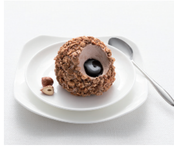
TARTUFO ALLA NOCCIOLA