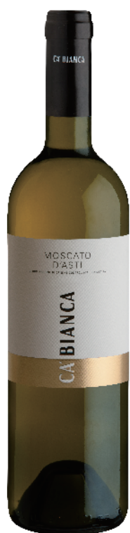
Moscato D'asti DOCG Tenimenti Ca' Bianca 26.00 €