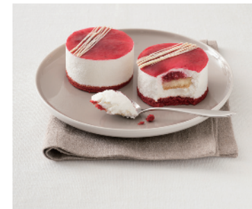
CREMOSO AI FRUTTI ROSSI