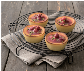
CHEESECAKE ALLE FRAGOLE CATALOGO