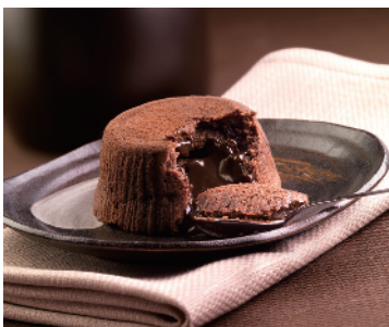
SOUFFLÉ CIOCCOLATO ALTA