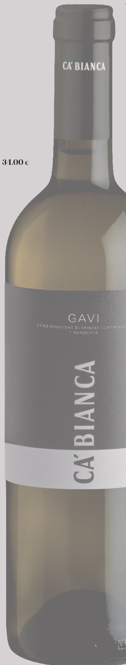
Gavi DOCG Tenimenti Ca' Bianca 34.00 €