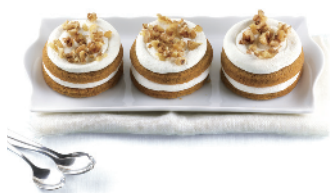
CARROT CAKE MONO