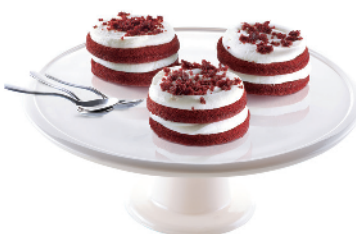
RED VELVET MONO