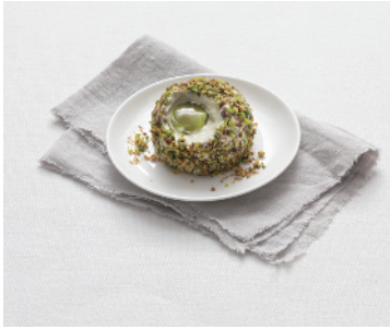
TARTUFO AL PISTACCHIO