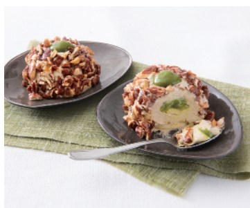
CROCCANTE AL PISTACCHIO