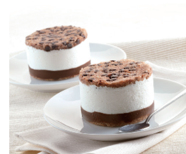
RICOTTA E CIOCCOLATO MONOPORZIONE