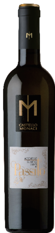
Moscatello Selvatico Passito Salento IGT Castello Monaci 40.00 €